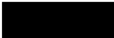
WH Develop s.r.o Ing. Jan Nádraský – na základě plné moci -zhotovitel-